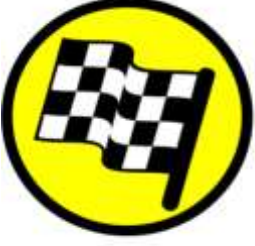
FF'e 100 m

Stop noktasında bir sonraki normal etap (liaison) için zaman verilir.