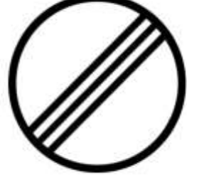
Stop Noktasının Sonu