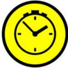
ZK Alanına Giriş

Zaman Kontrol noktaları (ZK) aşağıdaki simgelerle işaretlenmiştir.