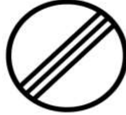
ÖE Start Alanının Sonu