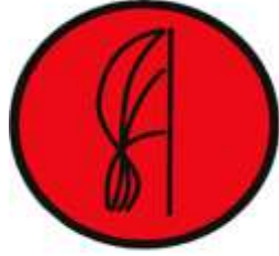
ÖE Start Noktası